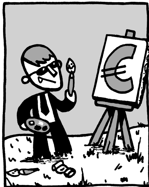
le think tank Bruegel