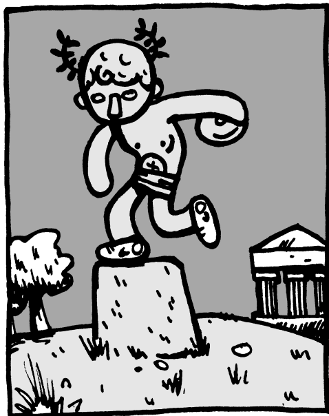
Après les baskets Nike